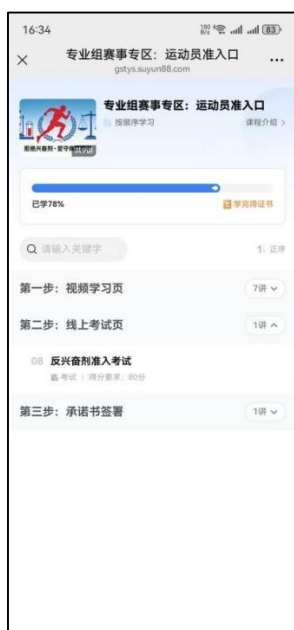
图 11 考试入口

1. 【专业组赛事专区】和【运动员家长专区】课程学习完成后，依次点击【线上考试页】-【反兴奋剂准入考试】，进入考试页面答题；