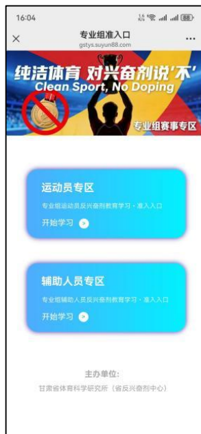
图 7 专业组赛事专区