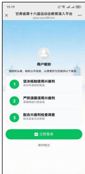
图 1 登录

1.微信扫码/点击网址进入平台，选择【立即登录】，授权微信个人信息登录后，点击【直接生成新学员】；