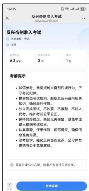
图 12 考前提示