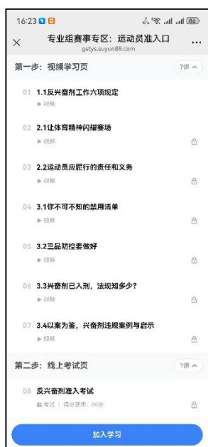
图 9 课程学习入口