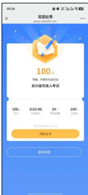
图 15 生成证书提示