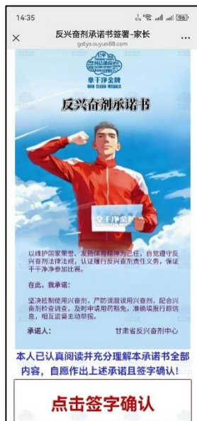
图 18 签字承诺