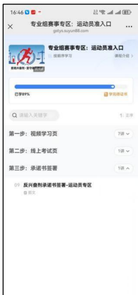
图 17 承诺书签署