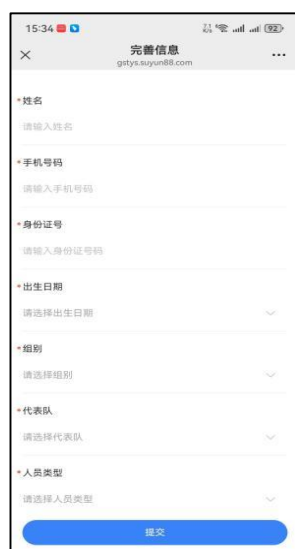
图 4 填写个人信息