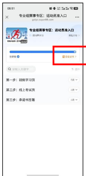
图 20 查看证书