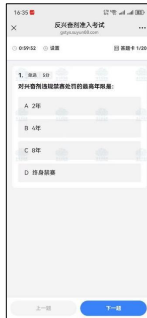
图 13 考试界面