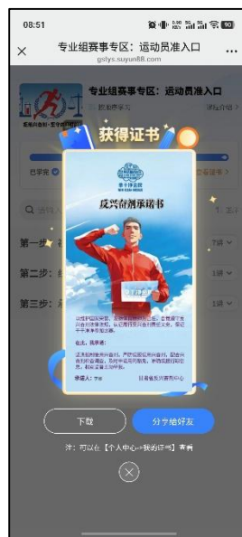
图 21 下载承诺书