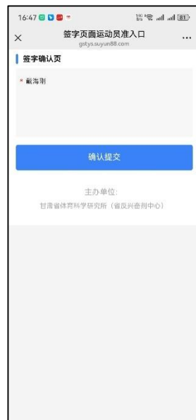
图 19 填写本人姓名