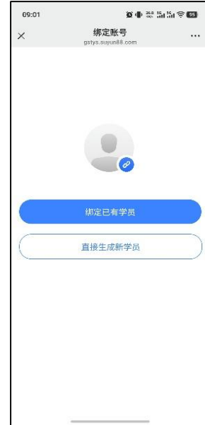
图 3 生成新学员

2.页面自动跳转至注册信息界面，准确填写个人信息，并按实际情况选择组别、人员类型、运动项目及代表队；