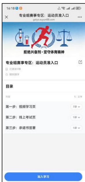
图 8 学习考试目录