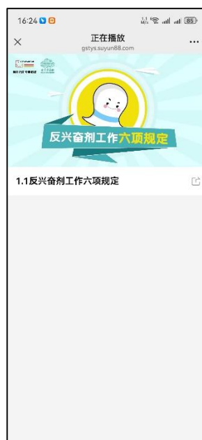
图 10 课程学习界面