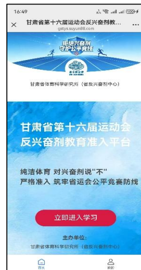
图 5 教育准入平台