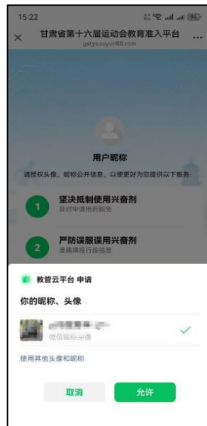
图 2 授权个人信息