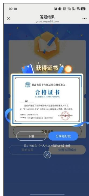
图 16 下载合格证书